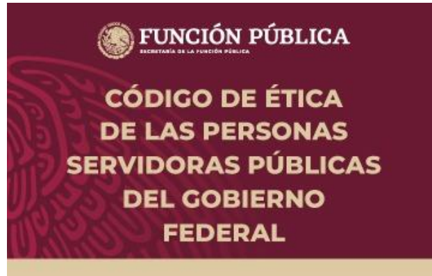
Código de Ética de las personas servidoras públicas del Gobierno Federal

Conoce, y consulta el Código de Ética de las personas servidoras públicas del Gobierno Federal y el Código de Conducta de la Secretaría de Comunicaciones y Transportes, y alinea el desempeño de tus funciones en estricto apego a los principios, valores y reglas de integridad, y los demás preceptos establecidos en ellos.