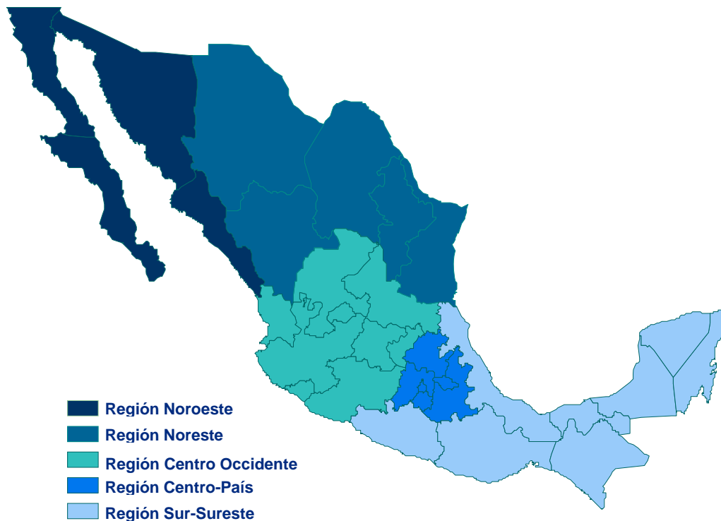
Figura 2.1 Regionalización, Presidencia 2001

La primera clasificación corresponde a la figura 2.1, la cual es idéntica a la propuesta por Luis Unikel (1978) en la década de los años setenta; y la segunda, a la presentada en el sexto informe de Gobierno del Presidente de la República Vicente Fox Q. para describir las mejoras realizadas a la red carretera durante el sexenio 2000-2006.