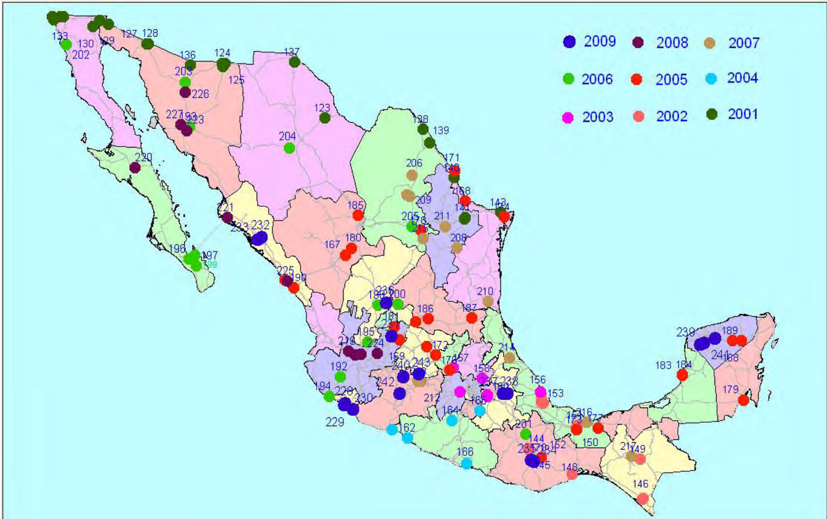
Figura 3.1. Ubicación de las estaciones instaladas del 2001 al 2009