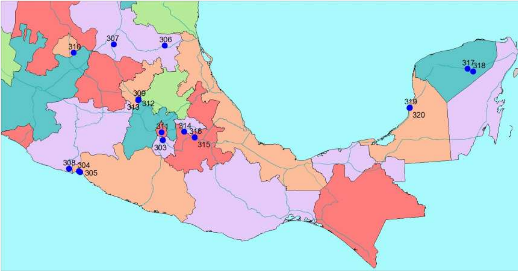
Figura 1.1 Ubicación de las estaciones instaladas en el 2013